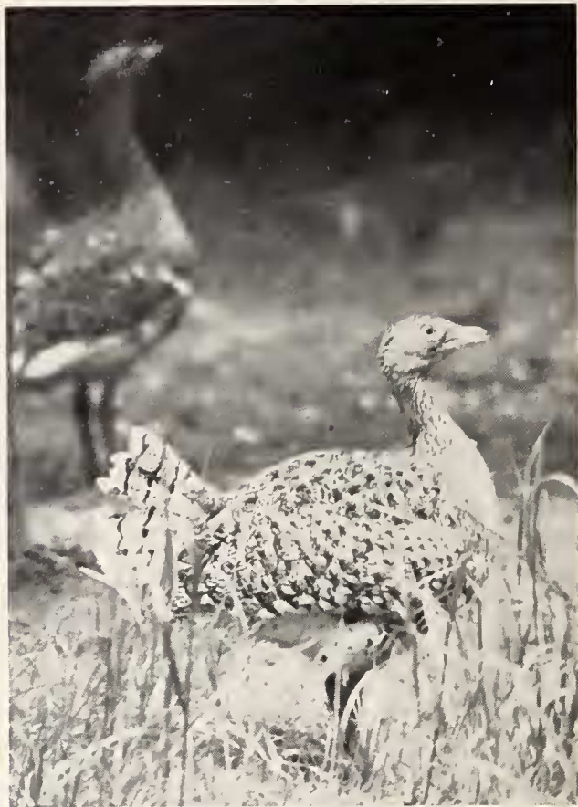
Abb. 2: Abwehrendes Schwanzfächern der Henne gegen den (im Bild nicht sichtbaren Hahn).

abends bei der Nahrungssuche, deren Geschlecht aber nicht einwandfrei bestimmt werden konnte. Wahrscheinlich handelt es sich bei diesen Trupps um noch nicht geschlechtsreife Vögel. Nur ganz selten befanden sich in der Nähe ausgefärbte Hähne.